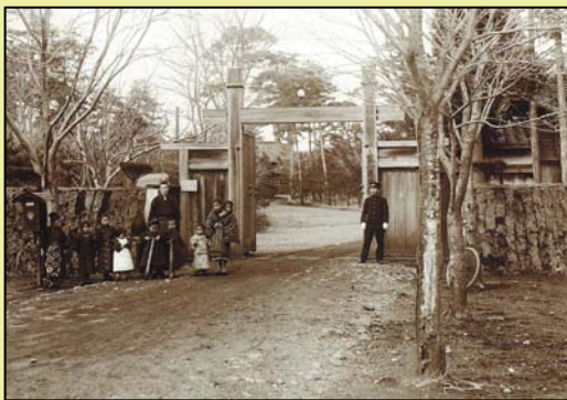
↑ 全生園正門(明治42年～大正初期)

そのような中、病気が治癒して、戦後に自らの努力（療養所からの脱走も含む）で社会復帰を果たしたハンセン病の快復者は少なからずいました。しかし、たとえ病気が治っていても、ハンセン病に罹った自分が帰ることでの家族の困惑やそれから起こるであろう様々な事態を想像し、まっすぐ故郷に帰れる人は概して少なかったようです。また社会復帰後に結婚して家庭をもって、自らがハンセン病を患った過去は胸の内にしまい、けっして口外しないように努め、身構えている方がほとんどでした。また、 この病気を治療できる場所が療養所に限られていたことも、たとえば後遺症の治療などに大きな妨げ でした。